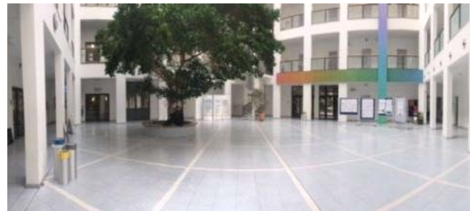
Atrium der Leopold-Ullstein-Schule